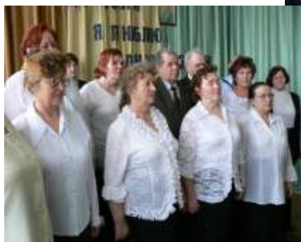
Хор «Ветеран» Санчурского РЦКиД