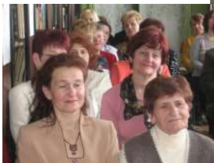
Рыжовские чтения, 2008 год