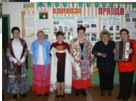
Встреча кировских гостей в Шишовской библиотеке